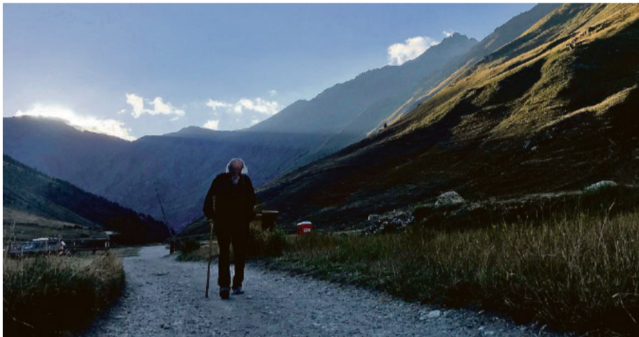
Una scena tratta dal docufilm "Ambin - La roccia e la piuma"

Il film è stato prodotto da Ines Cavalcanti per Chandra d'Oc, dall'Unione Montana Alta Valle di Susa e dalla Regione Piemonte all'interno del progetto "Amb.Enis - Interreg V-A Italia Francia Alcotra", dedicato al grande massiccio montuoso che si staglia ai confini tra l'Italia e la Francia e che riunisce alle sue pendici una molteplicità di culture, tradizioni, paesi e persone molto diverse ma con radici comuni. "Ambin è solo una parola scritta sulle mappe a indicare un insieme di montagne tra l'alta val Susa, la val Cenischia e il Moncenisio, rocce, sfasci morenici, ghiacciai... Affinchè Ambin possa trasformarsi da semplice parola a nome, serve uno sguardo capace di posarsi su quelle montagne e su quelle rocce, capace