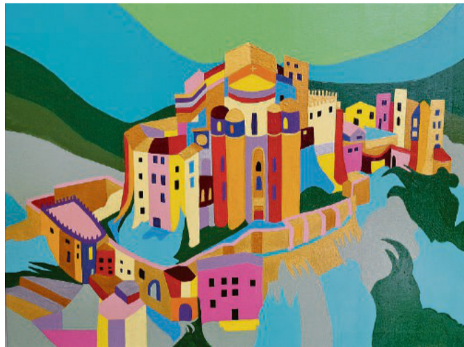
Una delle tele in mostra che ritrae la Sacra di San Michele